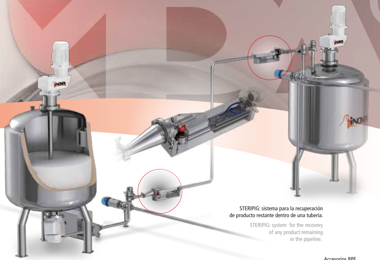
STERIPIG: sistema para la recuperación de producto restante dentro de una tubería. STERIPIG: system for the recovery of any product remaining in the pipeline.