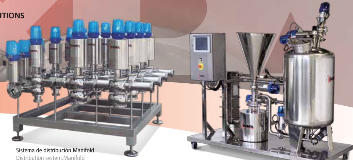
Sistema de distribución. Manifold Distribution system. Manifold