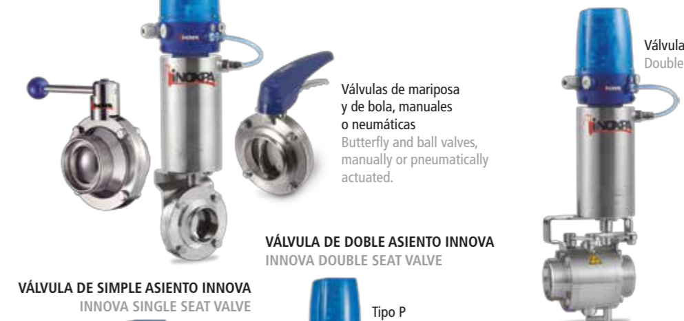
Válvulas de mariposa y de bola, manuales o neumáticas Butterfly and ball valves, manually or pneumatically actuated.