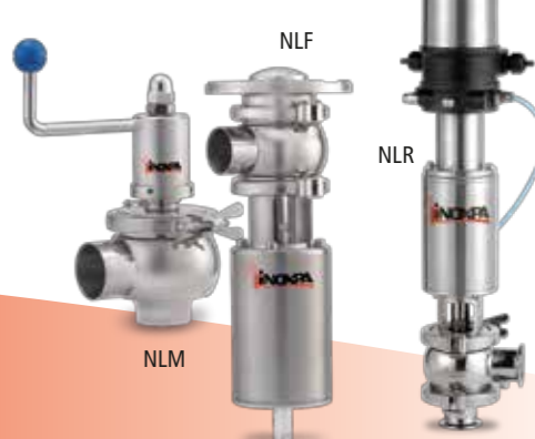
NLF NLR NLM