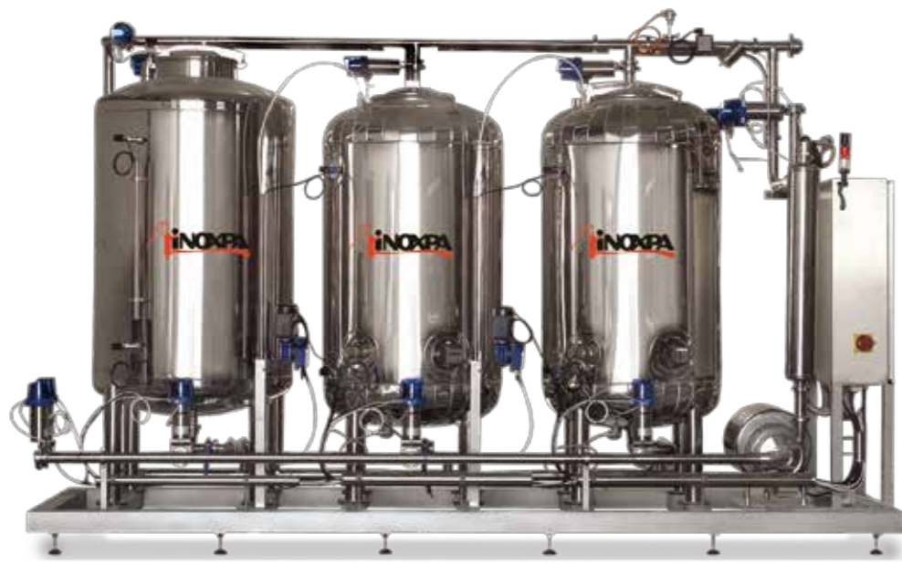
Sistema de limpieza CIP CIP system