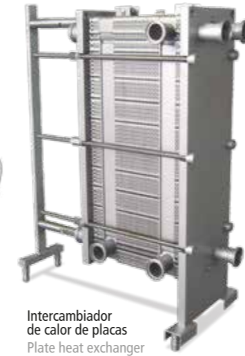
Intercambiador de calor de placas Plate heat exchanger