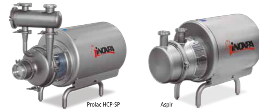
Prolac HCP-SP Aspir