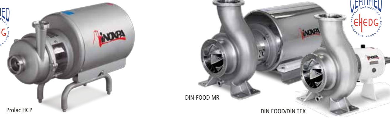
Prolac HCP DIN-FOOD MR DIN FOOD/DIN TEX