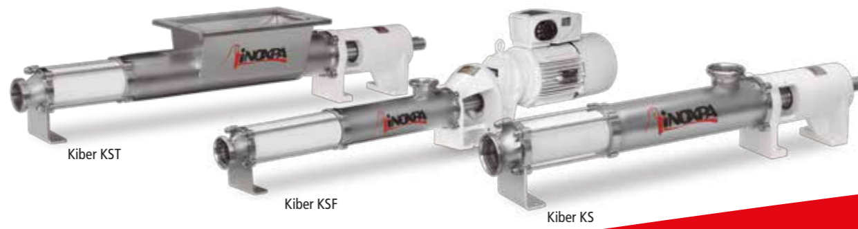
Kiber KST Kiber KSF Kiber KS