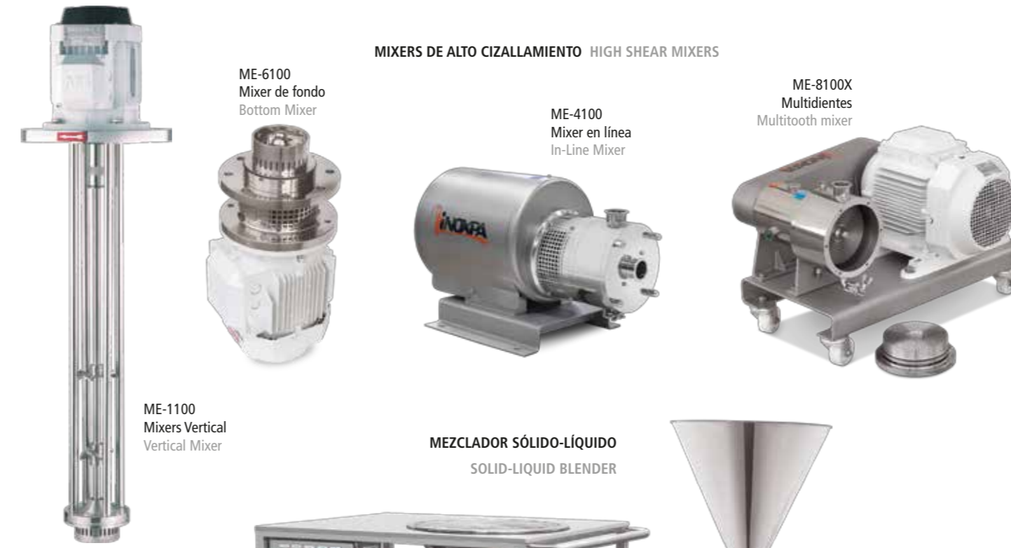
ME-6100 Mixer de fondo Bottom Mixer ME-4100 Mixer en línea In-Line Mixer ME-8100X Multidientes Multitooth mixer