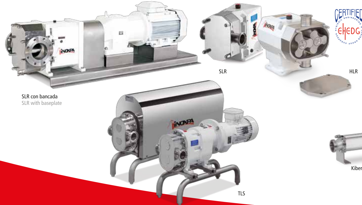
SLR con bancada SLR with baseplate SLR HLR TLS