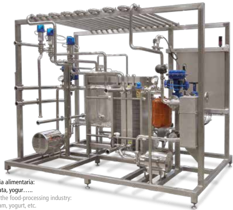
Pasteurizador para la industria alimentaria: zumo, leche, nata, yogur,.... Pasteuriser for the food-processing industry: juice, milk, cream, yogurt, etc.