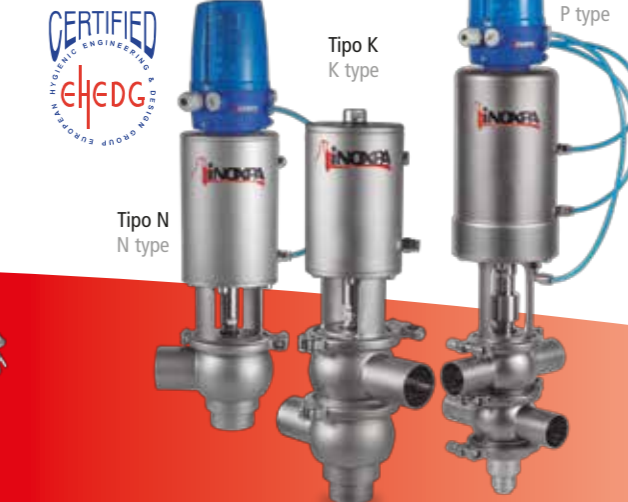
Tipo N N type Tipo K K type Tipo P P type