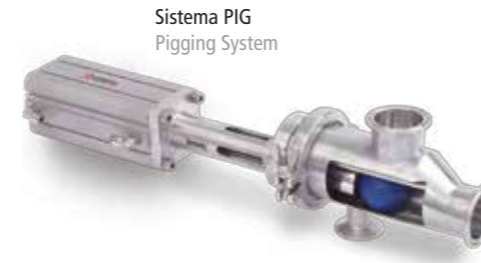
Sistema PIG Pigging System