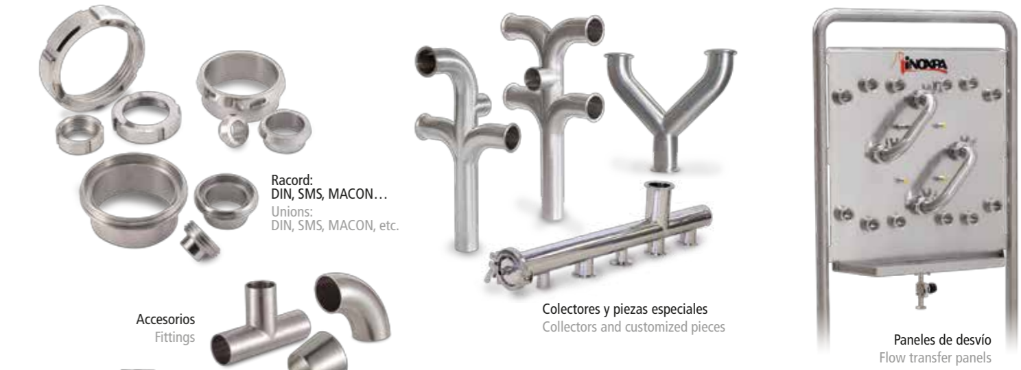
Accesorios Fittings Colectores y piezas especiales Collectors and customized pieces Paneles de desvío Flow transfer panels