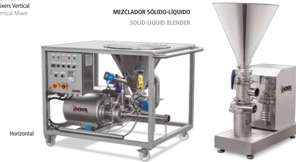
Horizontal Gama M M series