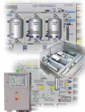
Automatización: PLC, paneles de control Automation: PLC, control panels, etc.