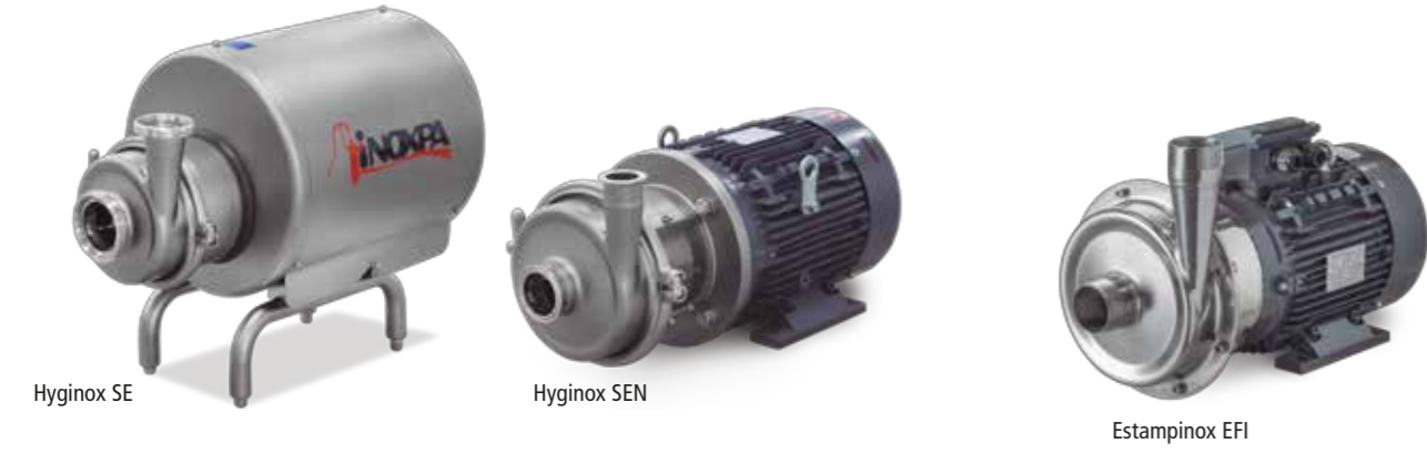
Hyginox SE Hyginox SEN Estampinox EFI