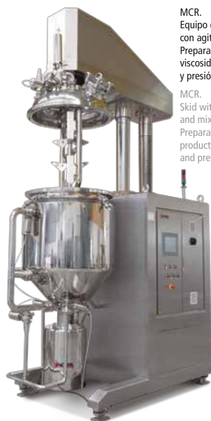
MCR. Equipo de mezcla con agitador contra-rotación y mixer. Preparación de productos de alta viscosidad a temperatura y presión controlados MCR. Skid with counter-rotating agitator and mixer. Preparation of highly viscous products at a controlled temperature and pressure