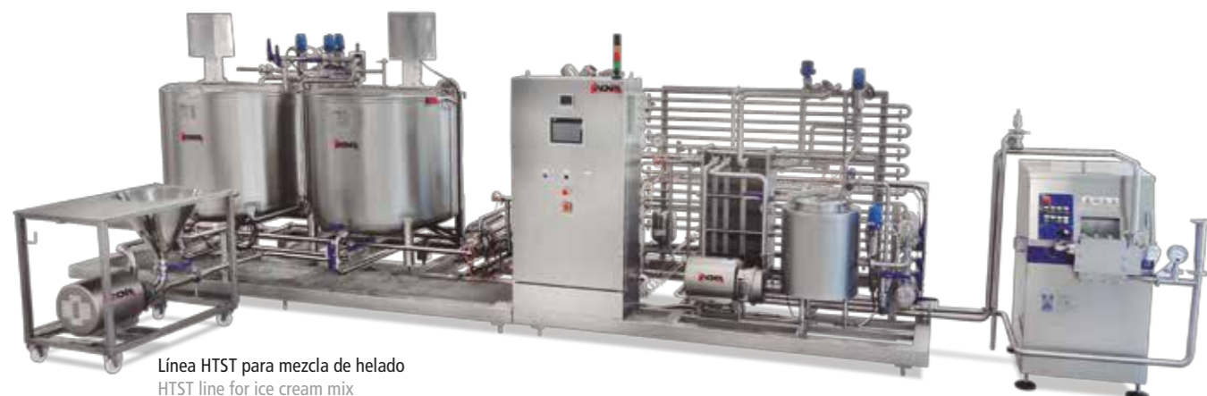
Línea HTST para mezcla de helado HTST line for ice cream mix