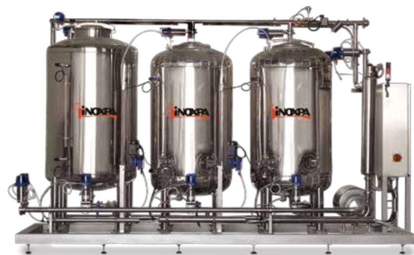
Sistema de limpieza CIP CIP system