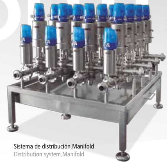
Sistema de distribución. Manifold Distribution system. Manifold