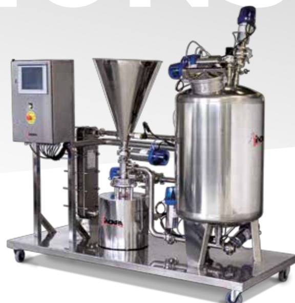
Sistema de mezcla sólido-líquido automatizado Automated solid-liquid mixing system